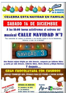
CARTEL DE LA FIESTA DE NAVIDAD 2017 (16/12/2017)

Se han establecido diferentes vocalías que se encargan de diferentes temas y eventos: