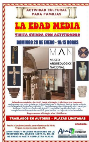
CARTEL DE VISITA A LA EXPOSICIÓN EDAD MEDIA (28/01/2018)