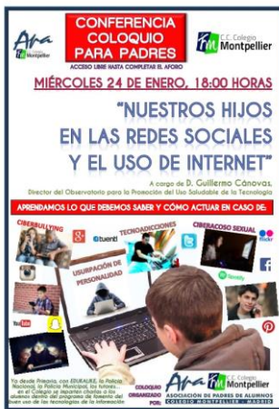
CARTEL DE CONFERENCIA SOBRE REDES SOCIALES (24/01/2018)

También organiza el mercadillo de uniformes y libros en el colegio a finales de curso.