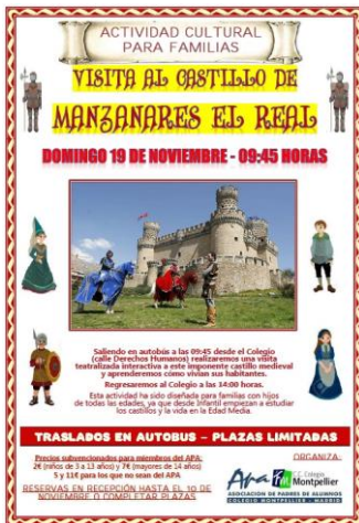
CARTEL DE VISITA GUIADA AL CASTILLO DE MANZANARES (19/11/2017)

Además el APA financia la revista "MONTPE", junto con la aportación de sus anunciantes y colaboradores, con una tirada de más de 1.700 ejemplares por número, amplia distribución y una excelente acogida entre todas las familias, personal del Colegio, colaboradores y visitantes.