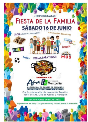
CARTEL DE NUESTRA GRAN FIESTA DE LA FAMILIA 2017 (16/06/2018)

Desde el APA agradecemos el constante apoyo de las familias y continuamos trabajando en un sinfín de pequeños detalles para intentar que la vida de todos los que formamos la gran familia de nuestro colegio sea un poco más agradable.